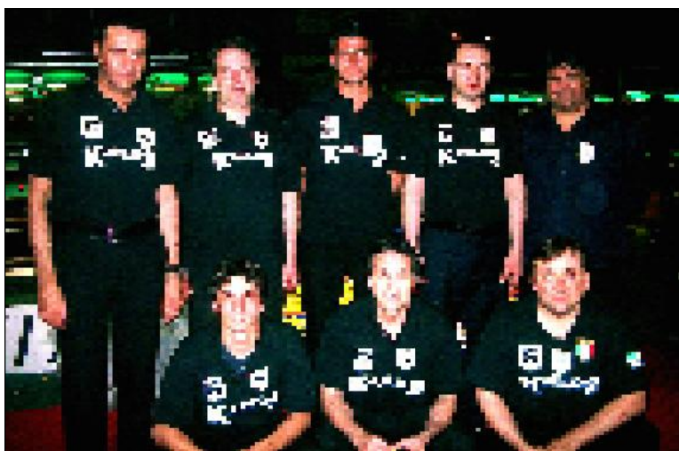
1° class. Selezione RIMINI "1° categoria"