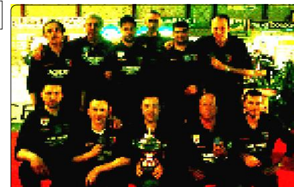
C.S.B. TOSSIGNANO (Imola)