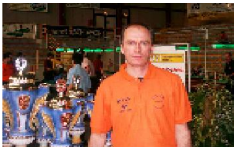
9° class. Pronti Onide (RN)