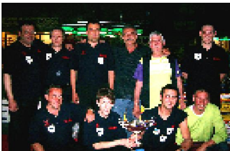
1° class. Selezione IMOLA "3° categoria"