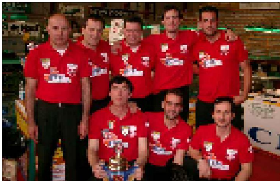
1° classificati Campionato ROMAGNOLO GORIZIANA a squadre "serie