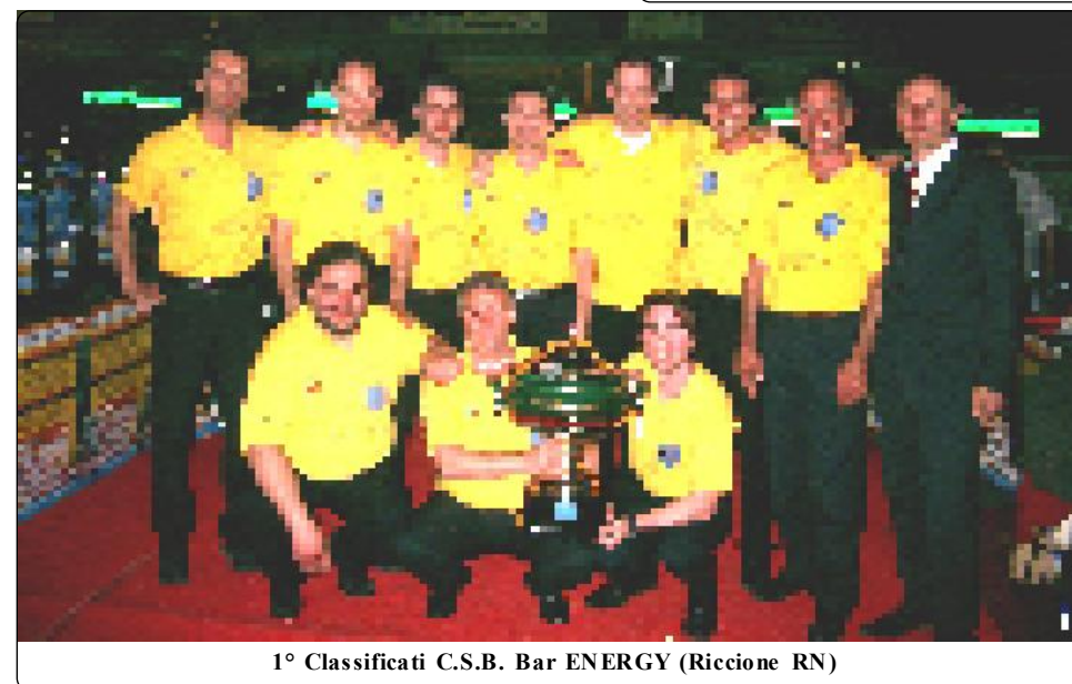
1° Classificati C.S.B. Bar ENERGY (Riccione RN)