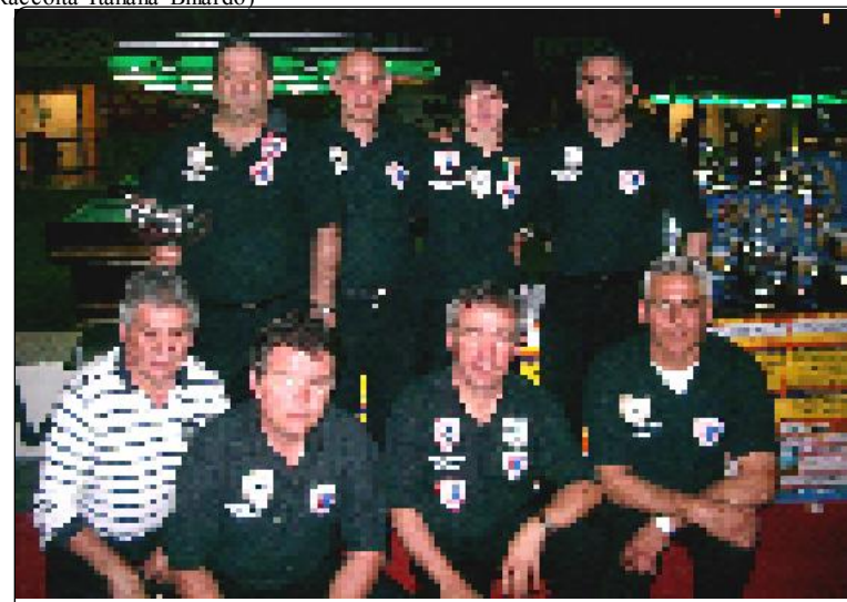
1° class. Selezione BOLOGNA "2° categoria"