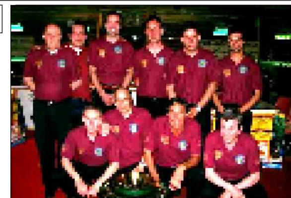
C.S.B. SIRENELLA (Cattolica RN)