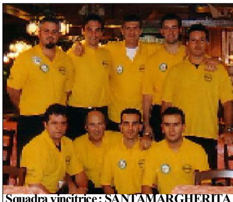
Squadra vincitrice: SANTAMARGHERITA

Inaugurazione ufficiale del MESE del BILIARDO con premiazioni delle squadre del Campionato Regionale di "A1" premiazione del CSB Santamargherita (Bellaria) come vincitrice del Campionato Romagnolo di "A1"