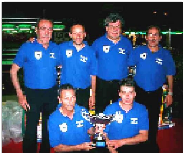
1° class. Selezione RAVENNA