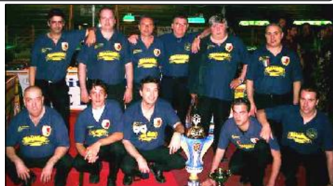
C.S.B. Bar Plutone (Campioni Romagnolo "A2")

Anno 07 - Numero 24 - del 21 Giugno 2006