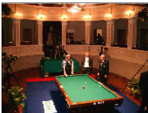
Lo Stupendo Teatro di MONTELUPONE (MC)