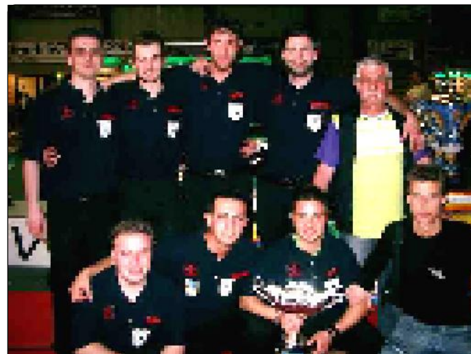
1° class. Selezione IMOLA "Under 23"

Il C.R.I.B. (Centro Raccolta Italiana Biliardo)