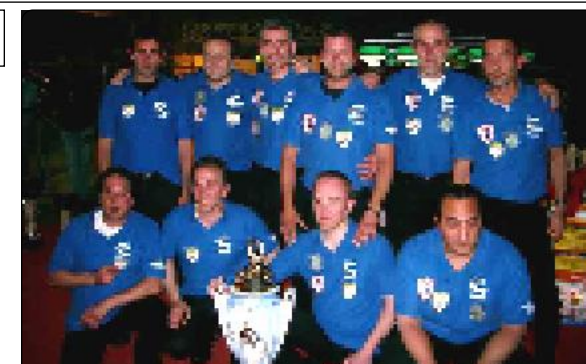
C.S.B. DA BREGA (Imola)