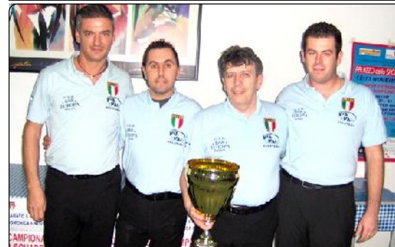
1°class. Bar Europa (Ravenna)

Registrazione al Tribunale di Rimini N° 9/03 del 09/06/2003