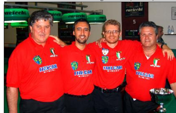
1°class. Bar Filon (Rimini)