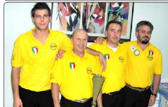
1°class. Bar Santamargherita (Rimini)