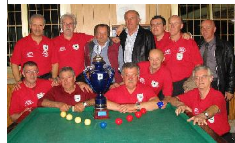
1° class. serie "C" - CSB KOBRA (Bologna)

E' TEMPO DI FINALI All'interno i quadri dei Campionati Provinciali e Play Off di: