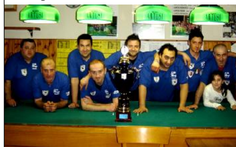
1° class. serie "B" CSB DA BREGA (Imola)