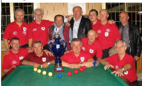
1° class. serie "C" - CSB KOBRA (Bologna)