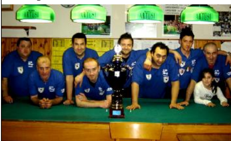
1° class. serie "B" CSB DA BREGA (Imola)