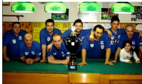
1° class. serie "B" CSB DA BREGA (Imola)