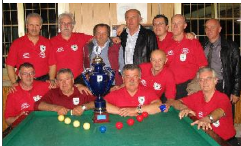
1° class. serie "C" - CSB KOBRA (Bologna)

All'interno a cura del settimanale CRIB Barzellette e Notizie Curiose Le Battute dal libro "Le Formiche" di Gino e Michele Matteo molinari