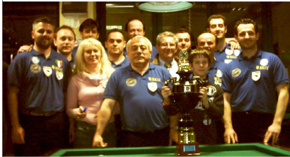
1° classificati CSB Bar PRESIDENT (Forlì)