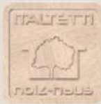
Italtetti Holz & Ko s.r.l.