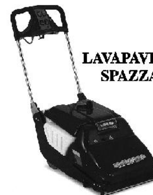
LAVAPAVIMENTI E SPAZZATRICI