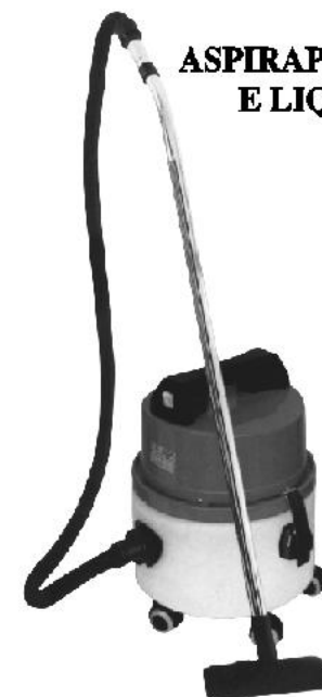
ASPIRAPOLVERE E LIQUIDI