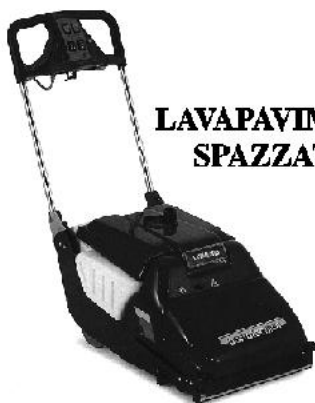
LAVAPAVIMENTI E SPAZZATRICI