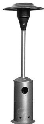
GENERATORI D'ARIA CALDA