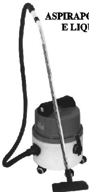
ASPIRAPOLVERE E LIQUIDI