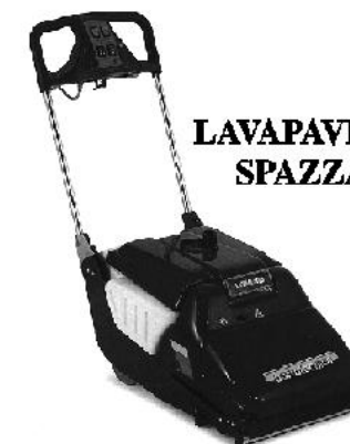
LAVAPAVIMENTI E SPAZZATRICI