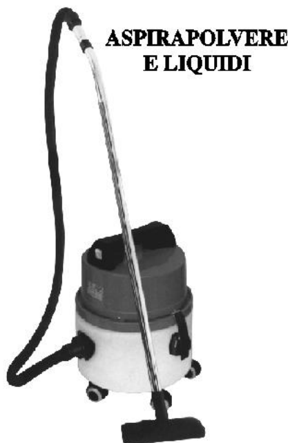
ASPIRAPOLVERE E LIQUIDI