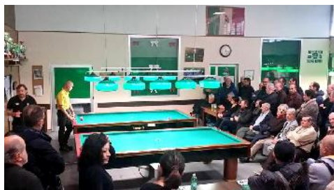
Panoramica del pubblico nel torneo del Ambrogino D'Oro