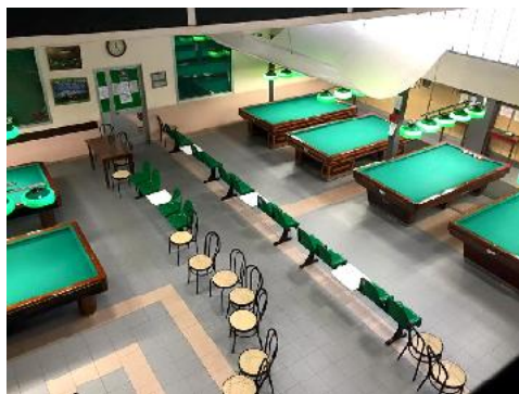
Sala Biliardi del c.s.b. Giambellino Piazza Tirana, 18 Milano