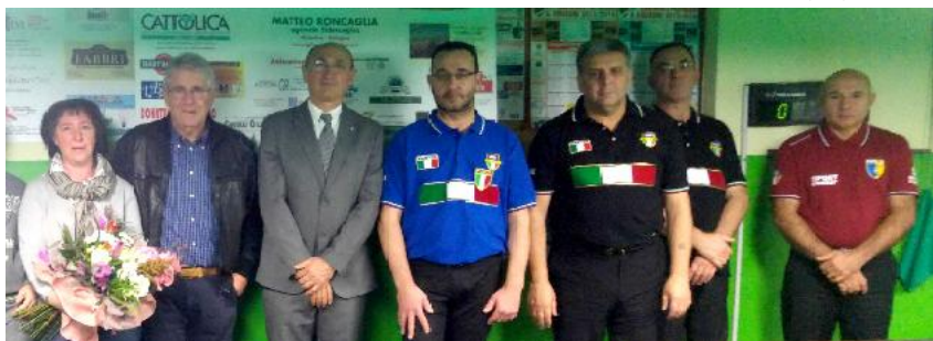
Finalisti Memorial ZELANI

1 Prova SELEZIONE Master Goriziana 2016/2017 con Master Goriziana Domenica 18 Ottobre 2015 - Centro Sociale Sasso Morelli Imola (Bo)