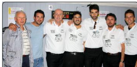
Formazione di CESENA (Fc)