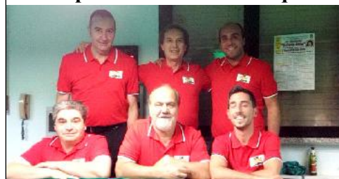
Formazione CRIB Rimini