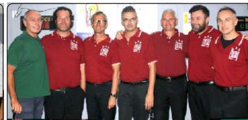
Formazione VILLANOVA (Ra)