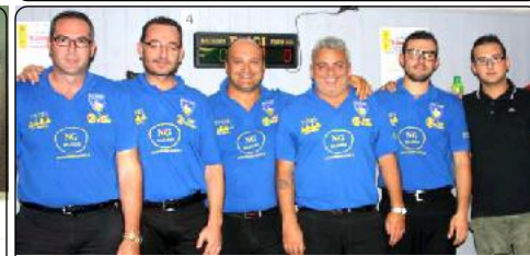
Formazione di CERVIA (Ra)

Anno 16 - Numero 02 - del 11 Ottobre 2014