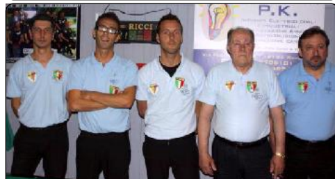
Formazione CATTOLICA (Rn)