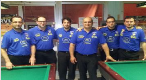
Formazione di CERVIA ravenna