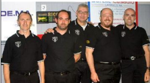
Formazione di MACERATA