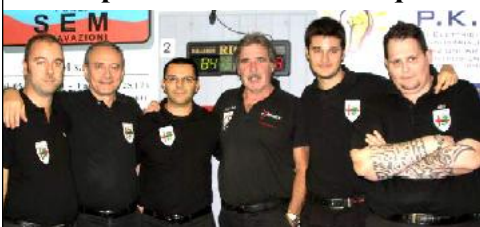
Formazione di MILANO