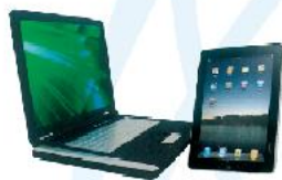
Notebook e iPad tablet