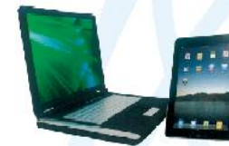
Notebook e iPad tablet