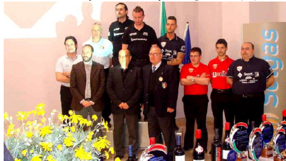
Finalisti del Campionato Italiano 2011/2012 "Coppie 3° categoria" e il Comitato organizzatore della Regione Marche

Campionato ITALIANO 2011/2012 "coppie 3° categoria" Domenica 15 Aprile 2012 - Centro Sportivo Sagrini - Fermo (FM)