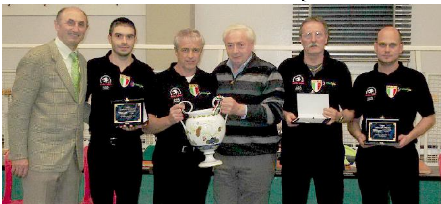
Bar MOIE Ancona