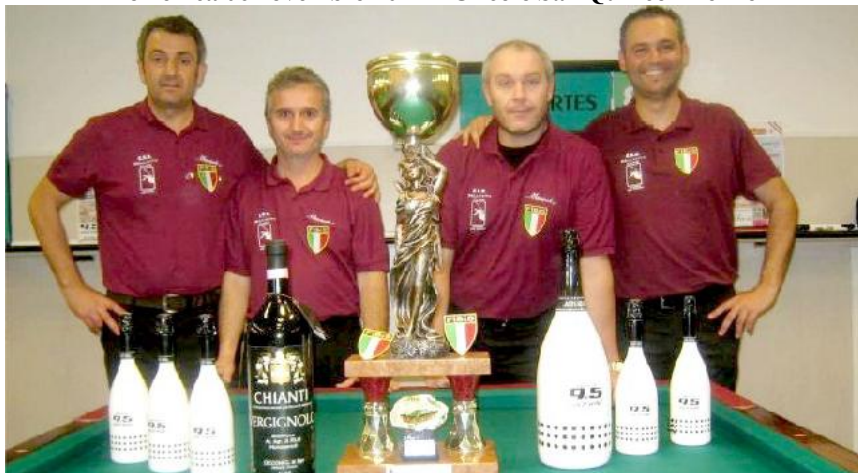
Bar BELLAVITA CAFFE' Ravenna