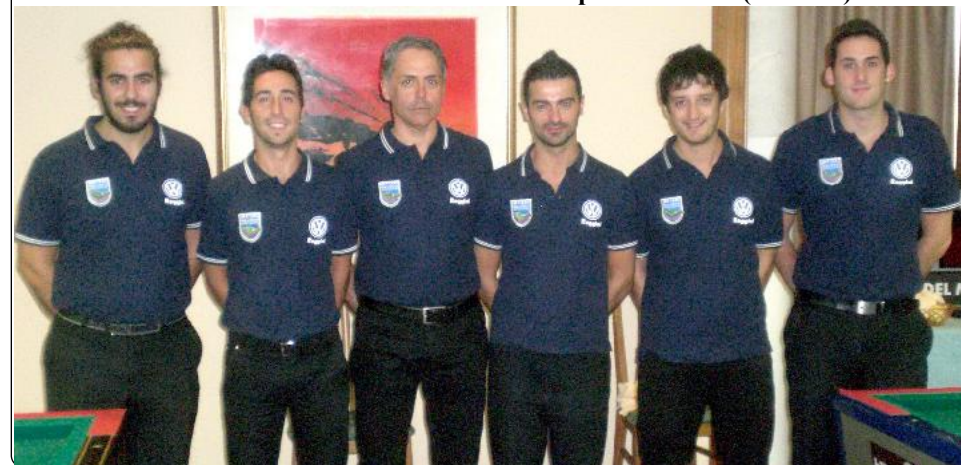
Bar PERLA VERDE Riccione (RN)