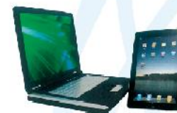
Notebook e iPad tablet