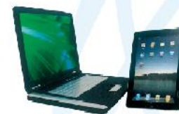
Notebook e iPad tablet