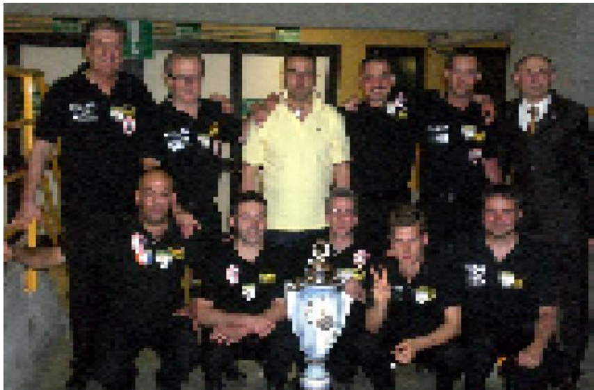
Formazione del c.s.b. Ponte Santo.