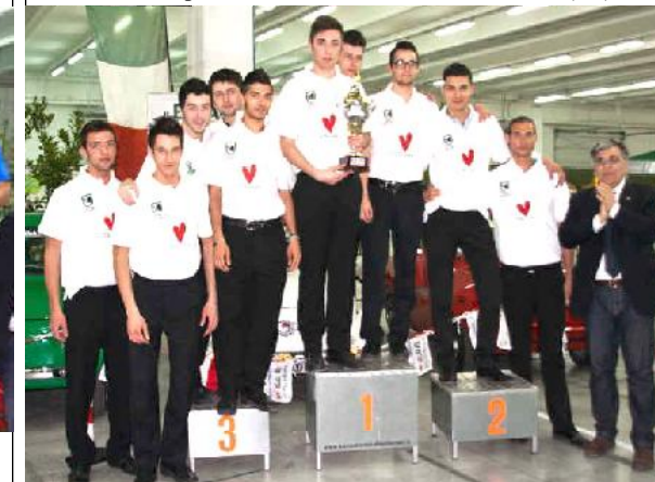
La rappresentativa "UNDER 23" della regione Marche che ha superato la rappresentativa "UNDER 23" dell'Emilia Romagna per 4 a 3

Centro Sportivo Molino di Tenna - Fermo (AP)